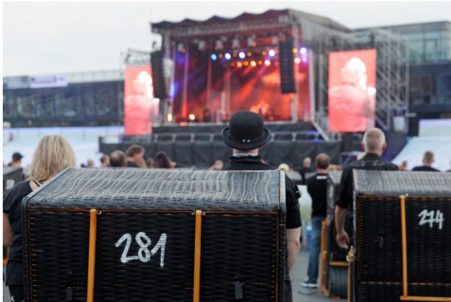
Die etwas andere Beachparty: im Strandkorb genießen Fans das Konzert der Hamburger Darkrocker