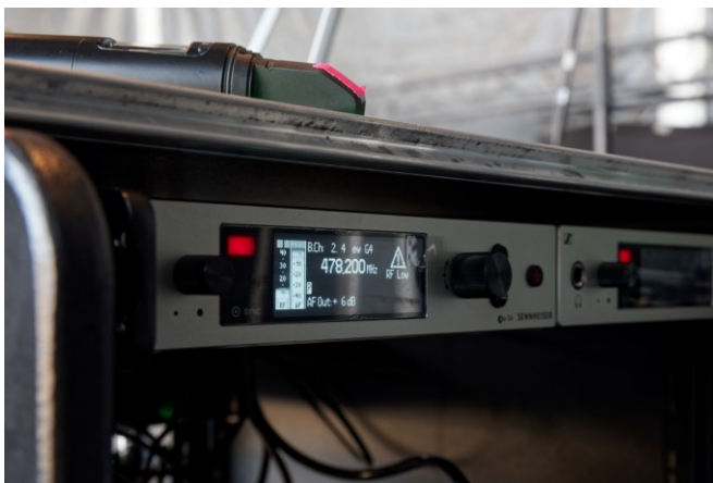
Als Empfänger für die Instrumente dienen zwei Sennheiser EM 300-500 G4 True-Diversity-Empfänger mit 88 MHz Schaltbandbreite

Die Signale von E-Bass und E-Gitarre werden bei MONO INC. mit Sennheiser SK 500 G4 Taschensendern übertragen. Als Empfänger dienen zwei Sennheiser EM 300-500 G4 True-Diversity-Empfänger mit 88 MHz Schaltbandbreite, die im Frequenzband AW+ (470 MHz bis 558 MHz) betrieben werden. „Vorher stammten diese Sendestrecken von einem anderen Hersteller und arbeiteten im Bereich um 2,4 GHz – das konnte wirklich kein Mensch gebrauchen ...“, so Sören Lentz. „Unsere neuen Sennheiser Instrumentensender funktionieren im Gegensatz zu ihren amerikanischen Vorgängern stabil und Drop-outs sind nun zum Glück kein Thema mehr! Die Musiker freuen sich neben dem hervorragenden Sound darüber, dass ihr Aktionsradius auf der Bühne nun nicht mehr eingeschränkt ist. Mit den Sennheiser Drahtlosprodukten bin ich rundum zufrieden. Dank der Neuanschaffungen können wir den Funk bei MONO INC. sortenrein betreiben.“